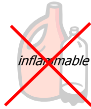
Schéma Sécurité boîte à feu